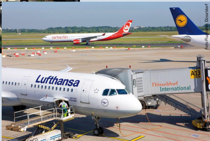
Wichtiges Drehkreuz für Nordrhein-Westfalen: Der Flughafen Düsseldorf International.