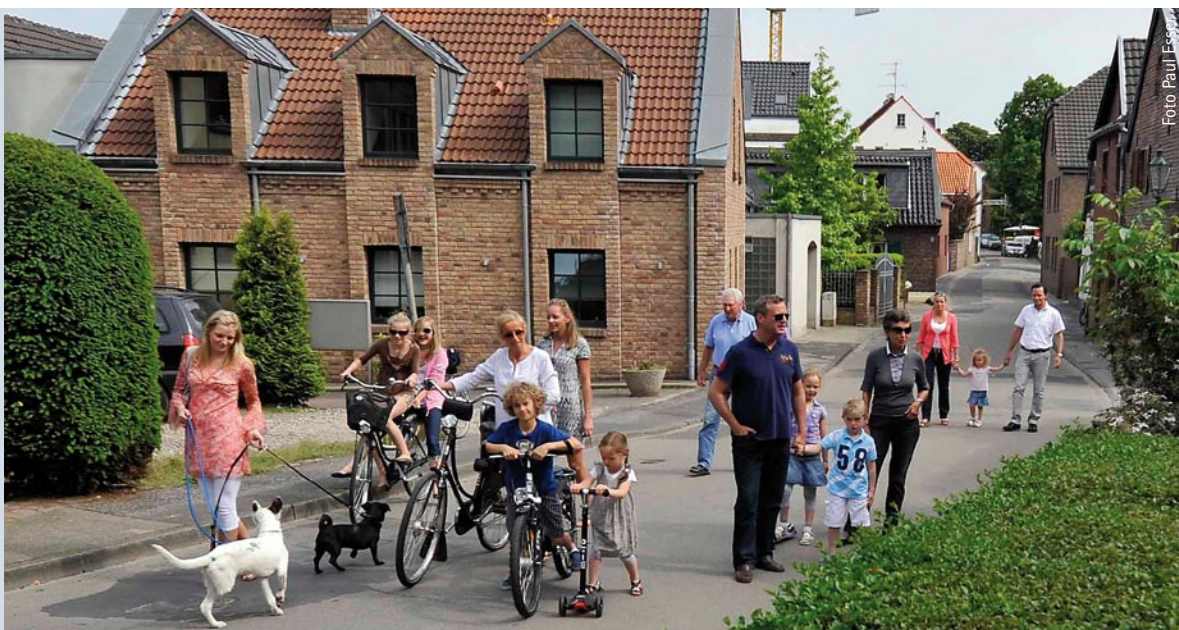
Die Bevölkerungsprognose der Planungsregion ist nicht nur günstiger als für NRW insgesamt, sondern auch günstiger als für den gesamten Regierungsbezirk Düsseldorf.