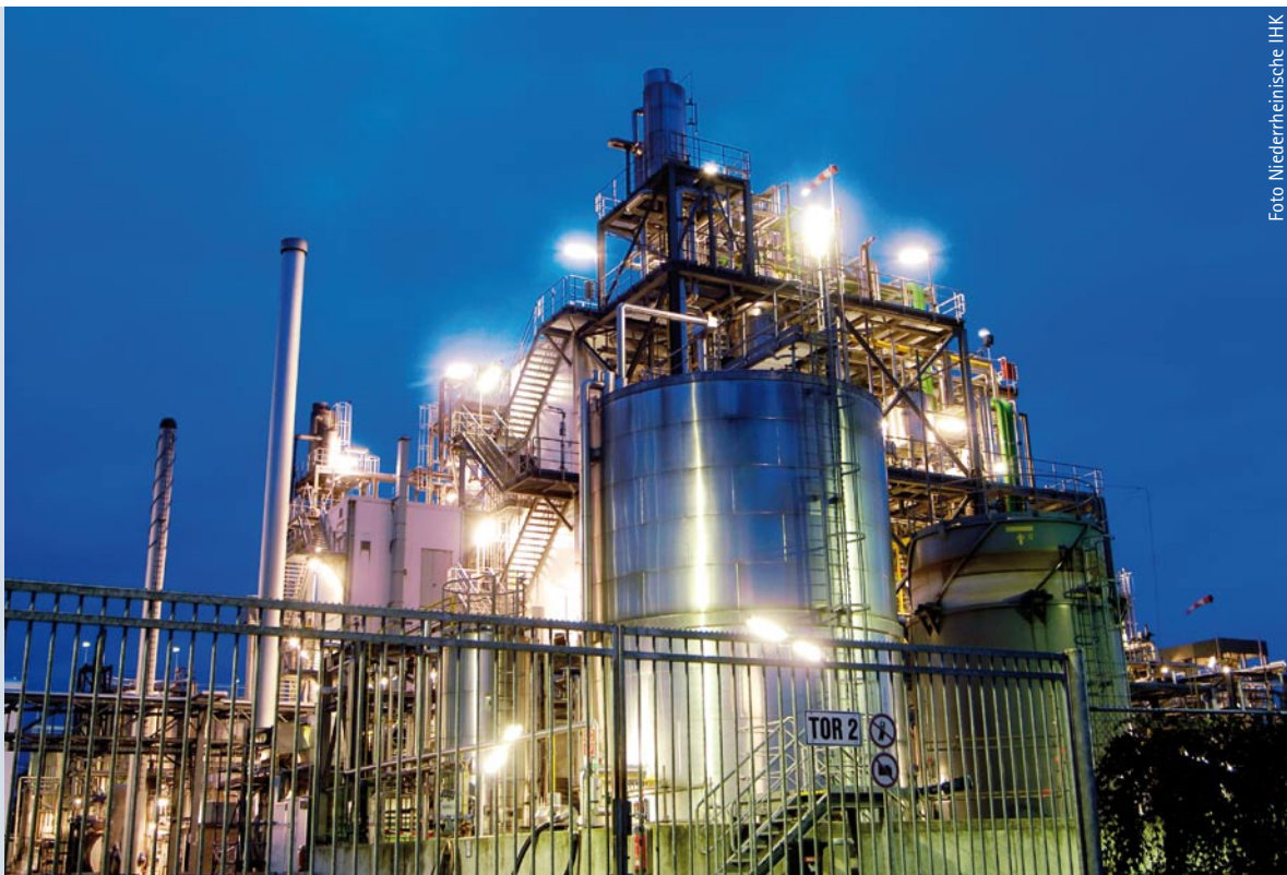
Industriekulisse in Emmerich am Rhein.

Von diesem Prozedere auszunehmen sind Erweiterungsflächen ortsansässiger Betriebe. Betriebe, die Flächen vorausschauend kaufen, um über ausreichende Entwicklungsflächen zu verfügen, handeln nicht nur ökonomisch, sondern auch ökologisch vernünftig. Betriebliche Konzentration vermeidet die Inanspruchnahme neuer Flächen und unnötige Verkehre zwischen verschiedenen Standorten. Deshalb sind unternehmensbezogene Reserveflächen bei der Ermittlung des gesamtstädtischen Gewerbe-/Industrieflächenbedarfs als bereits genutzte Flächen zu werten und nicht als verfügbare Reserveflächen.