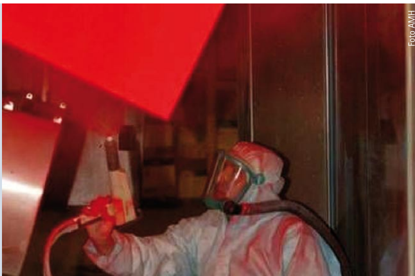
Auch emittierende Betriebe des Handwerks benötigen Flächen in Gewerbegebieten.

So mangelt es beispielsweise im bergischen Städtedreieck aufgrund der Topografie und der gewachsenen Strukturen an großen zusammenhängenden Gewerbeflächen. Dort, wo es diese gibt, bestehen zum großen Teil hohe Auflagen, die die