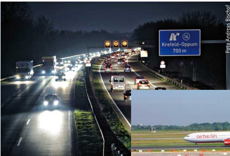
Die A57 verbindet den linken Niederrhein mit den Niederlanden.