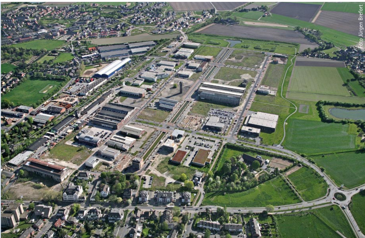
Dienstleistung, Gewerbe und Handwerk statt Stahlproduktion: Im Willicher Gewerbpark Stahlwerk Becker haben sich in den vergangenen Jahren zahlreiche Unternehmen in denkmalgeschützten Gebäuden angesiedelt.

Das gilt für die Chemische und die Pharmazeutische Industrie, die Metallindustrie, den Maschinenbau, die Energieversorgung, die Telekommunikation und die Informationstechnik.